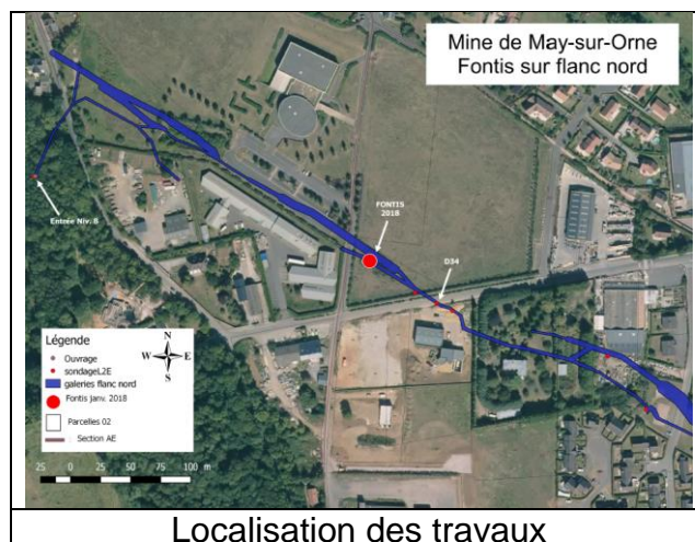
Localisation des travaux