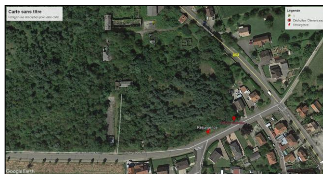
Emplacement de la résurgence

Les travaux consistent à la recherche de l'origine de cette résurgence et les possibilités de traitement à la source et de vérifier l'état du drainage raccordé au déshuileur Clémenceau existant le long de la voirie.